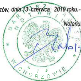
Notariusz Bartosz Paszek

Chorzów, dnia 13 czerwca 2019 roku.-----